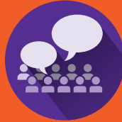
Reuniones de Exploración con el Público