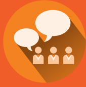
Reuniones de Exploración con Agencias